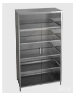
AШ-5 (1/2 стекло) AШ-6 (2/2 стекло)

Марка стали AISI 304. Изготовлен из профильной трубы 30 x 30 x 1,5 мм и листа толщиной 1 мм. Конструкция – сварная, сборно-разборная. Двери и боковые стенки – двойные. Петли дверей – осевые. Двери – металлические (стеклянные). Могут оснащаться замками. Стандартное количество полок – 3. Снабжен винтовыми опорами.