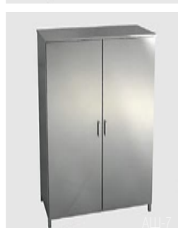
AШ-7 (2-х дверный) AШ-8 (4-х дверный)

Марка стали AISI 304. Изготовлен из профильной трубы 30 x 30 x 1,5 мм и листа толщиной 1 мм. Конструкция – сварная, сборно-разборная. Боковые стенки – двойные. Двери – металлические (стеклянные). Могут оснащаться замками. Стандартное количество полок – 4. Снабжен винтовыми опорами.