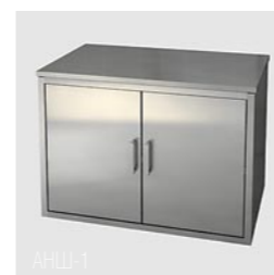
АНШ-1 (металлические дверцы) АНШ-2 (стеклянные дверцы)

Марка стали AISI 304. Изготовлен из профильной трубы 20 x 20 x 1,5 мм и листа толщиной 1 мм. Конструкция – сварная, сборно-разборная. Полки – вкладные, имеют бортик 20 мм. Конструкция снабжена винтовыми опорами. Укомплектованы пластиковыми колесными опорами на резиновом ходу диаметром 70 мм. Стандартное количество полок – 4 шт.