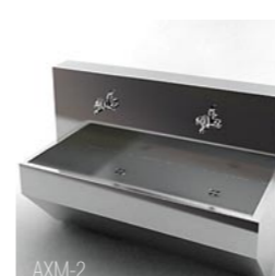
АХМ-1 (1-местный) АХМ-2 (2-местный) АХМ-3 (3-местный)

Марка стали AISI 304. Изготовлен из профильной трубы 30 x 30 x 1,5 мм и листа толщиной 1 мм. Конструкция – сварная. Стол снабжен двумя цельнотянутыми мойками из нержавеющей стали, размером 400 x 400 мм и глубиной 300 мм. Столешница может иметь пристенный бортик, высотой 100 мм. Снабжен винтовыми опорами.