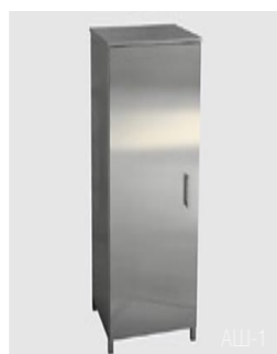
AШ-1 AШ-2 (2-х дверный) AШ-3 (1/2 стекло) AШ-4 (2/2 стекло)

Мы готовы предоставить Вам свой опыт, знания, производственный потенциал и высокий уровень работы для обеспечения Вашего успеха!